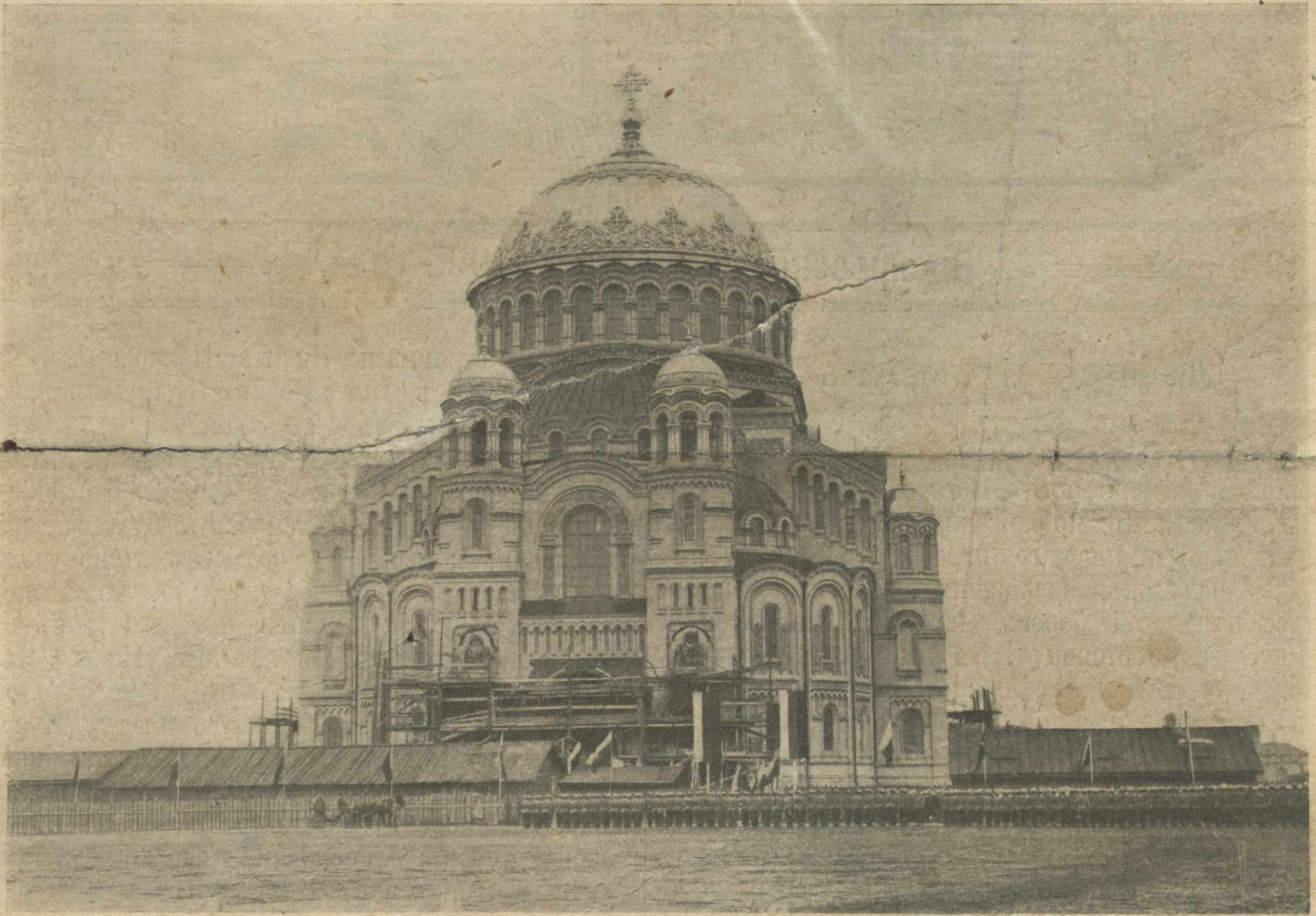
Вновь строящійся морской соборъ въ городѣ Кронштадтѣ.