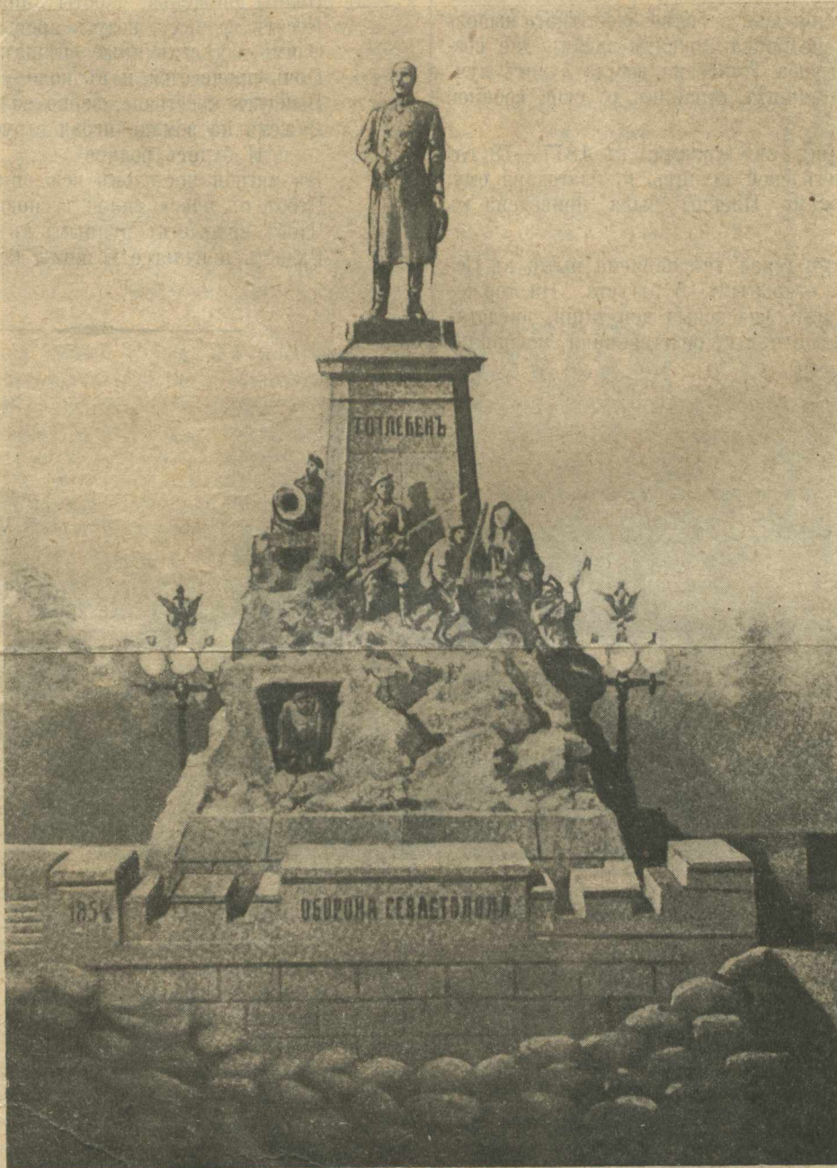
Памятникъ графу Э. И. Тотлебену, открытый 5 августа въ Севастополѣ.

Оборона Севастополя, обложеннаго союзными войсками — французами, англичанами, итальянцами и турками, въ 1854—1855 г.г., принадлежитъ къ числу событій, которыя глубоко западаютъ въ память народную. Сверхчеловѣческіе подвиги защитниковъ города не умрутъ въ сердцѣ русскихъ;