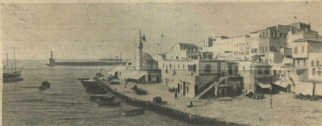
Крѣпость Канея на островѣ Критѣ.

графа и многочисленная публика. Вокругъ памятника построились войска всѣхъ родовъ оружія съ депутаціями съ вѣнками. Послѣ обхода командующимъ войскъ, началось молебствіе. При провозглашеніи царскаго многолѣтія крѣпостныя орудія, полевая артиллерія и суда флота произвели салютъ. Затѣмъ провозглашена вѣчная память боярину Э. Тотлебену. Съ памятника спала пелена. Войска отдали честь. Духовенство во главѣ съ епископомъ Алексѣемъ, послѣ провозглашенія многолѣтій воинству и всѣмъ вѣрнопопданымъ, окропило памятникъ святой водой. Командующій войсками поздравилъ войска съ открытіемъ памятника и предложилъ здравицу за Государя Императора. Могучее „ура“ слилось съ звуками народнаго гимна. Депутаціи возложили вѣнки, среди которыхъ былъ вѣнокъ отъ Государя Императора изъ живыхъ цвѣтѣвъ. Войска перестроились и прошли, въ предшествіи должностныхъ лицъ, передъ памятникомъ церемониальнымъ маршемъ. Въ шествіи принимали участіе ученики и ученицы учебныхъ заведеній.